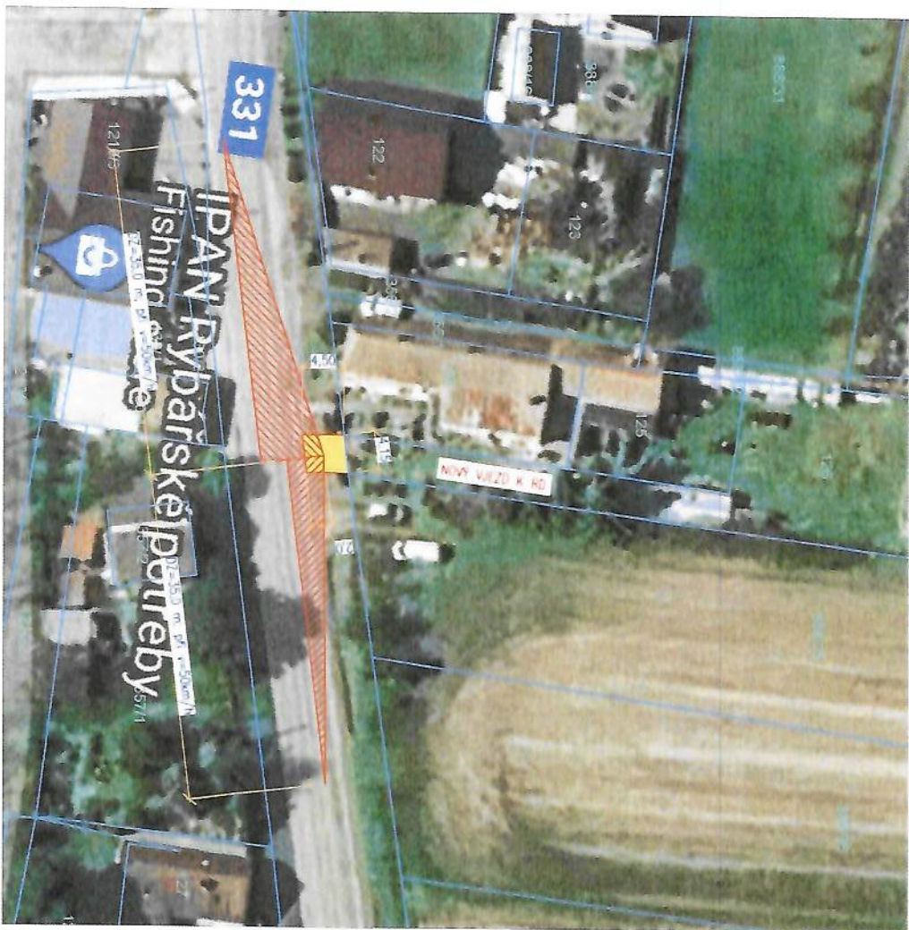
ROZHLÉDOVÉ TROJÚHELNÍKY DLE ČSN 73 6110/Z1

Dopravní připojení pozemku, parc. č. 126 v k.ú. Ostrá, na silnici II/331, se nachází v intravilánu obce Ostrá a je uvážováno s nejvyšší dovolenou rychlostí 50 km/h. Rozhledové poměry jsou sestaveny dle ČSN 73 6110/Z1 díky pro zastavení