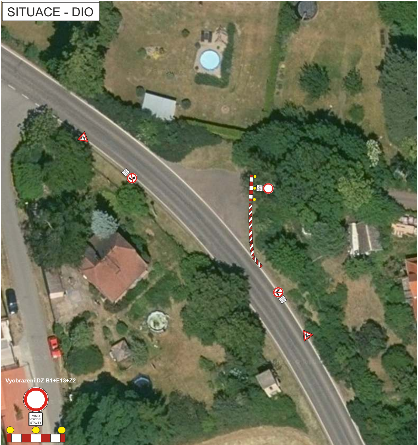
Vyobrazení DZ B1+E13+Z2 -